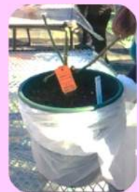
鉢植え後の状態です