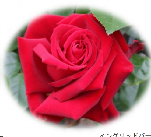
イングリッドバーグマン